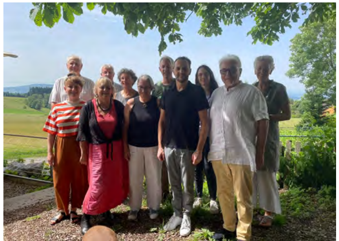
Treffen der Ambassadors am Bodensee, Juni 2025

Diese weitverzweigte Gruppe hat uns in vielen Dingen in diesem Jahr unterstützt. Im Juni 2025 gab es wieder ein Treffen am Bodensee mit elf Menschen. Konkret sind zwei neue Arbeitsgruppen, die sich regelmäßig treffen, gebildet worden: Eine zum Thema Werbung/Marketing und eine dazu, wie das Institut drängende Fragen der Zeit in die Arbeit integrieren kann. Im Juni 2026 soll ein weiteres Treffen der Ambassadors stattfinden.