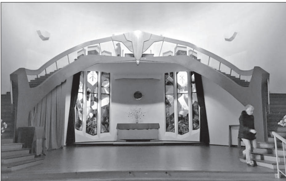
The Camphill Hall in Aberdeen

Fortsetzung nächste Seite unter dem Strich