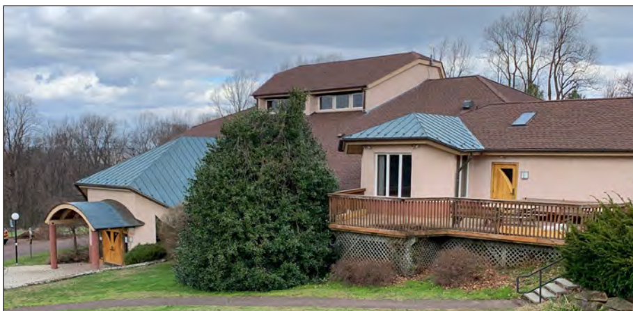
Whitsun Hall in Soltane where the new office will be