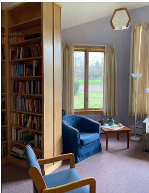
The Carlo Pietzner Library which will become the office of the Karl König Institute.

Der Vorstand in Soltane hat in großzügiger Weise dem Institut die schönen Bibliotheksräume (Carlo Pietzner Library – siehe Fotos) für die ersten drei Jahre kostenlos zur Verfügung gestellt und zwei der Stiftungen