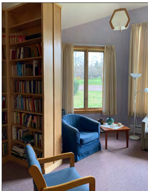
The Carlo Pietzner Library which will become the office of the Karl König Institute.

Der Vorstand in Soltane hat in großzügiger Weise dem Institut die schönen Bibliotheksräume (Carlo Pietzner Library – siehe Fotos) für die ersten drei Jahre kostenlos zur Verfügung gestellt und zwei der Stiftungen