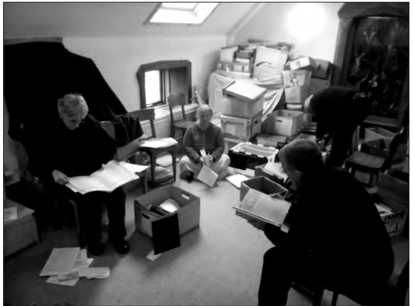
Work in progress at the Camphill Archive