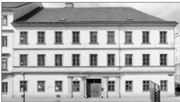
The building Im Werd 19 as it is today.

The building was Im Werd 19, in the 2 nd District of Vienna, near where Karl König grew up. It was not a hospital, but had been a house for the poor.