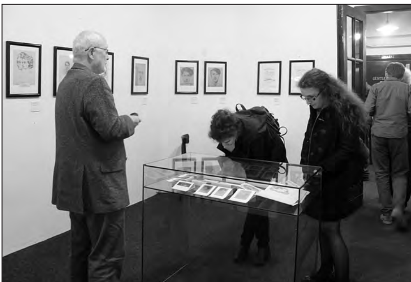
Die Ausstellung in Olomouc