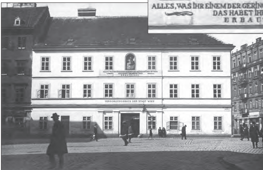
Historical photograph of Im Werd 19. In the inset the inscription.