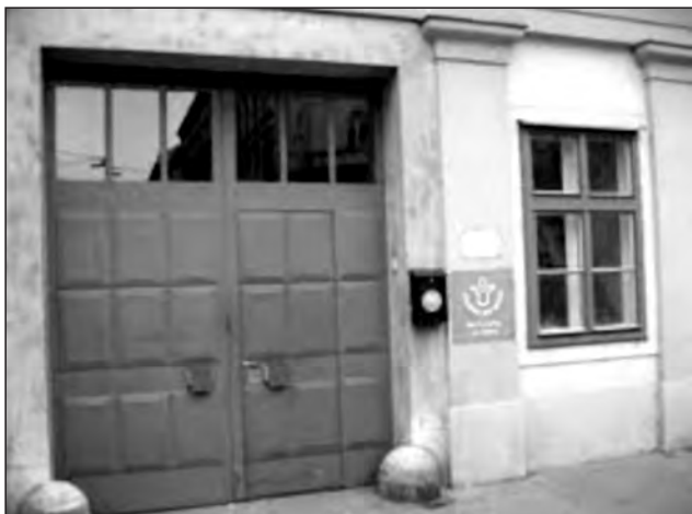
Der Haupteingang heute.

nung leben. Diese Betreuungsform hat sich als richtungsweisend herausgestellt—sie wird seit den 80er-Jahren international als Modell anerkannt.